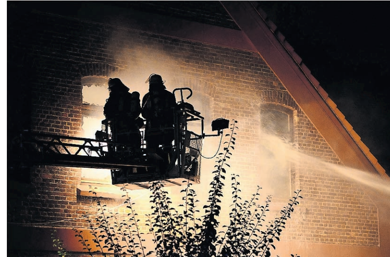
Feuerwehrmänner kämpfen gegen die Flammen im Scheeßeler Obdachlosenheim. Bei dem Feuer ist ein 59-jähriger Mann ums Leben gekommen. Fünf Bewohner des Wohnheims wurden verletzt, einer von ihnen schwer.