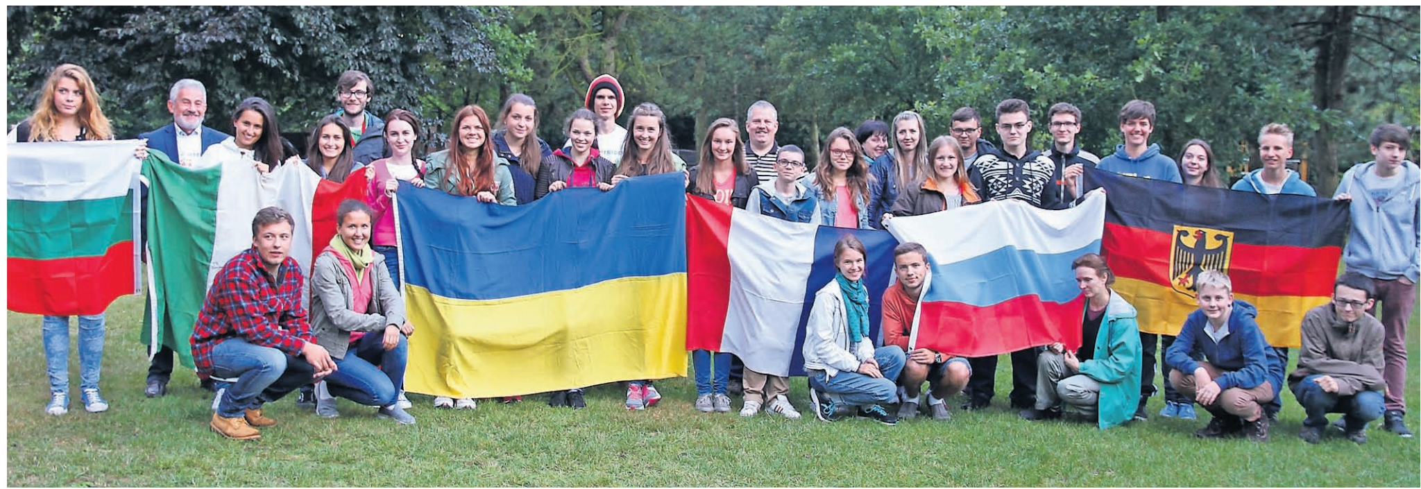
24 Jugendliche aus sechs Nationen starten in ein spannendes Workcamp rund um das Lager Sandbostel.